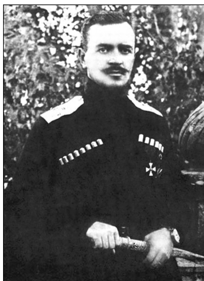
В.Л. Покровский — командир Кубанской конной бригады

Писать совершенно объективно о людях типа В.Л. Покровского крайне сложно. С одной стороны, образ его зловещ и мрачен из-за крайней жестокости по отношению не только к пленным и населению, но и к собственным подчинённым, что сделало его фигуру одиозной даже в рядах Белого движения. С другой — пылливый ум, мощные организаторские способности, полководческий дар, бескомпромиссный патриотизм в борьбе за единую и неделимую Россию, что, кажется, и ныне не потеряло своей актуальности. Так кто же он, генерал Покровский? Отважный авантюрист, человек войны или идейный борец с советской властью? Пусть читатель сам сделает свой вывод.