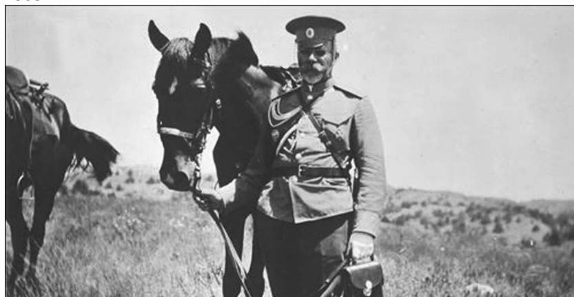
Офицер Генерального штаба на рекогносцировке стыка персидско-афганской границы 1909 г.

В последующем же, в частности в действиях под Журжей, как отмечал А.М. Зайончковский, «мы не видим той суеты и растерянности, которую обычно проявляли до того времени частные начальники в большинстве случаев их встреч с врагом... Уроки войны оказались с большой пользой для дела» 4 .