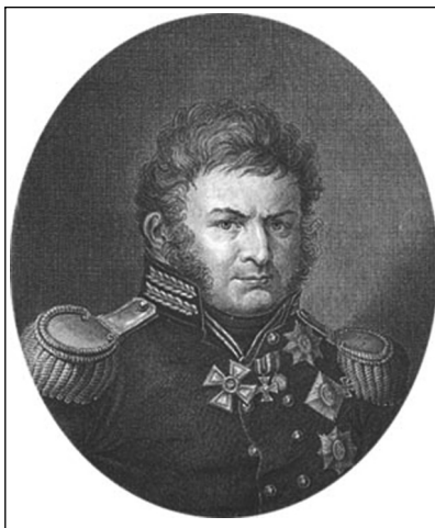
А.П. Ермолов Гравюра А.Г. Ухтомского с оригинала В.И. Машкова, 1810-е гг.