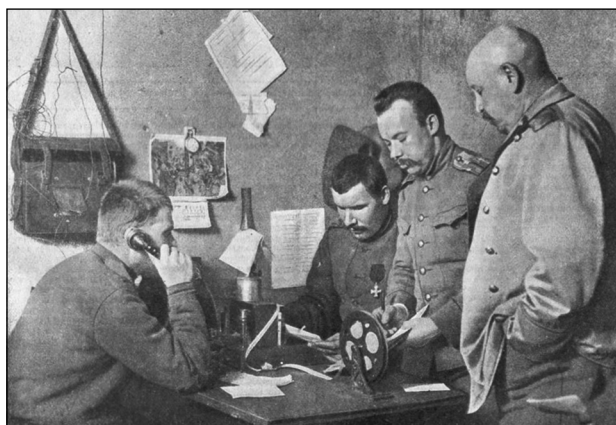
В штабе русского корпуса принимают важное донесение

Начиная с 1910 года задачу организации и ведения военной разведки в России осуществляло особое делопроизводство отдела генерал-квартирмейстера (ОГЕНКВАР) Главного управления Генерального штаба (ГУГШ). Но только лишь пять лет спустя была оформлена организационно и функционально соответствующая служба ГУГШ и ШВГ. При этом радиоразведка последнего занималась радиоперехватом сообщений войсковых радиостанций противника на фронтах. В начале 1915 года в действующих частях стали разворачиваться специальные радиостанции для ведения радиоразведки; во фронтовых и армейских радиодивизионах для радиоперехвата специально выделялись по две приёмные станции. В том же году появились полевые радиопеленгаторы, а в следующем на фронты прибыли и автомобильные. Установленные на двух машинах, они обслуживались расчётом из 16 человек. Для налаживания дешифровальной работы в июне 1916-го впервые