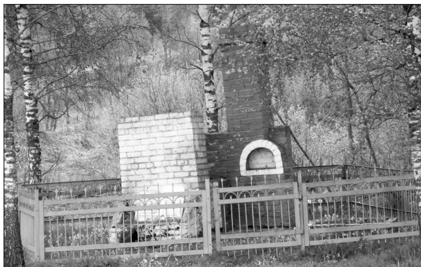
Памятник на месте деревни Колодезки