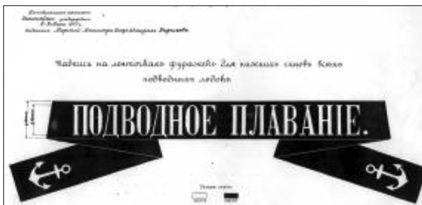
Рис. 1. Образец надписи на ленточках головных уборов для нижних чинов подводных лодок 1907 г.

Впервые о лентах к головным уборам в советском флоте упоминается в приказе Реввоенсовета Республики (РВСР) в 1921 году: «Фуражка без козырька с чёрной шёлковой лентой существующего образца и с надпи-