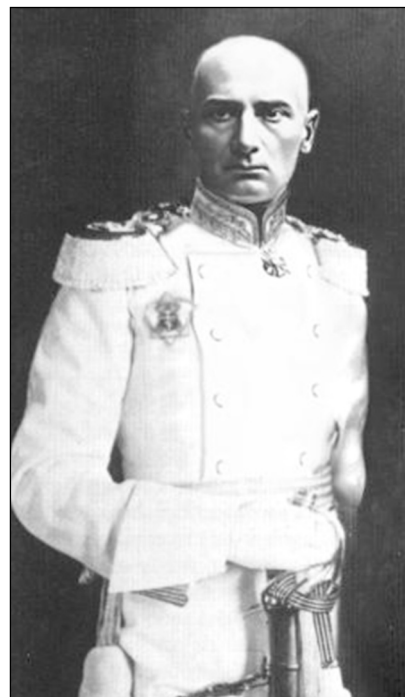
Вице-адмирал А.В. Колчак 1918 г.

Но было уже поздно. Недостаток угля, паровозов и постоянные недоразумения с чехами продолжали тормозить движение, и только в 20-х числах декабря поезд Колчака подошёл к станции Нижнеудинск. По пятам адмирала шли войска Красной армии, занимая город за городом, а впереди, на пути к Иркутску, вспыхивали восстания против колчаковского сибирского правительства, организованные Политцентром 13 . В Иркутске повстанцы 24 декабря заняли железнодорожный вокзал и предместье Глазково. Однако надежды лидеров Политцентра на массовую поддержку восставших не оправдались, и восстание забуксовало. Ни Политцентру, ни правительству В.Н. Пепеляева полностью взять ситуацию под свой контроль не удавалось. Представители союзников заявили о