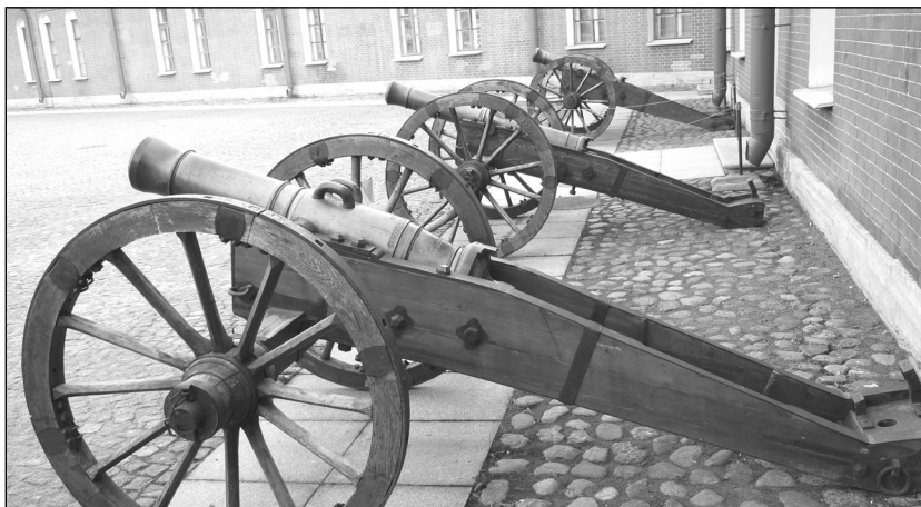
Пушки на лафете XIX в.

Проблемы, связанные с подвижными arsenалами в России, до сих пор являются «белым пятном» в отечественной историографии. Как правило, военные историки лишь касались этой темы, и только одному из arsenалов была посвящена специальная публикация 1 . Восполнить существующие пробелы, заложить основу для реконструкции процесса развития российских подвижных arsenалов, используя ранее не исследованные архивные материалы, — цель данной статьи.