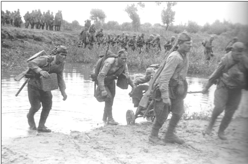
Наступление советских частей в Польше 1944 г.

17 января 1945 года Варшава была освобождена советскими