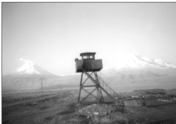
Пограничная вышка в горах

Сложная военно-политическая обстановка и начавшаяся Гражданская война не позволили создать стройную систему военно-инженерного и технического обеспечения сухопутных и морских рубежей. Только с передачей охраны границы сперва в ведение Всероссийской чрезвычайной комиссии (ВЧК), затем Государственного (позже Объединённого государственного) политического управления (ГПУ — ОГПУ) положение начало постепенно улучшаться. С созданием 27 сентября 1922 года Отдельного пограничного корпуса (ОПК) войск ГПУ укомплектование пограничных округов снаряжением и необходимыми техническими средствами временно возлагалось на военное ведомство. Опорой ему в его деятельности явилось постановление Совнаркома СССР (от 27 июля 1923 г.) об отводе земельных участков для инженерно-технического оборудования границ,