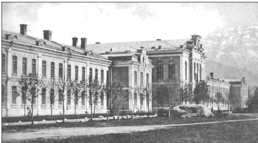
Здание Владикавказского кадетского корпуса Почтовая открытка. 1900-е гг.

История даже небольших военно-учебных заведений, как и крупных соединений и частей, является неотъемлемой составляющей военной летописи Отечества. Исходя из этого, автор предлагаемой статьи построила своё исследование на основе архивных материалов. Не обошла автор вниманием и различные публикации, включающие воспоминания, письма, официальные документы, освещающие почти тридцатилетнюю «воинскую биографию» Владикавказского кадетского корпуса.