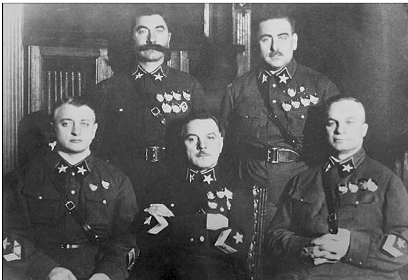
Первые Маршалы Советского Союза (слева направо): сидят — М.Н. Тухачевский, К.Е. Ворошилов, А.И. Егоров, стоят — С.М. Будённый и В.К. Блюхер 1935 г.

На Красную армию как силу, способную изменить политический строй в СССР, рассчитывали представители офицерства. Преемником Русской императорской и белых армий в эмиграции был Русский общевойсковой союз (РОВС), который унаследовал традиции Белого